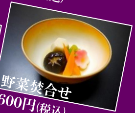
野菜焚合せ 600円(税込)

ご予算、ご要望に応じてご提案させていただきます。お料理の組合せ等もお気軽にご相談くださいませ。