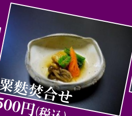
粟麩焚合せ 500円(税込)