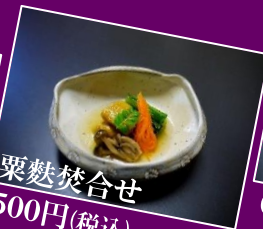
粟麩焚合せ 500円(税込)