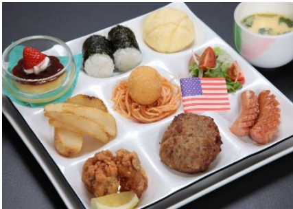
お子様ランチ 2,500円(税込)