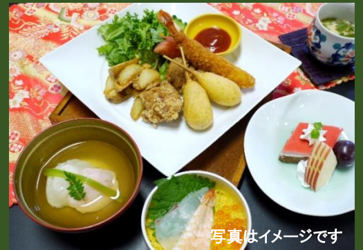
祝い膳 ※3日前までの要予約 3,600円(税込)