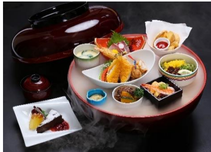
一寸法師御膳 4,200円(税込)